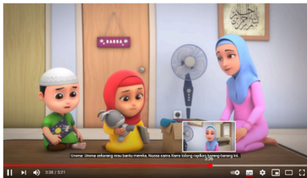
Tabel 1.6 Analisis Isi Scene: Nussa dan Rara ikut menyumbangkan barang