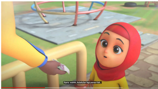
Tabel 1.3 Analisis Isi Scene 2 : Nussa dan Rara menolak pemberian Pak Kurir

Pak Kurir disamping motornya dan menata ulang barangnya dibantu dengan Nussa dan Rara