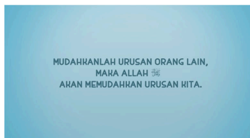
Tabel 1.7 Analisis Isi: Pesan Terakhir dengan Hadist

Perilaku menolong sesama umat manusia merupakan hal yang wajib hukumnya bagi umat muslim. Membantu mereka yang sedang tertimpa musibah adalah bentuk akhlakul karimah kepada sesama manusia. Apa yang dilakukan oleh keluarga Nussa terhadap keluarga Memey adalah wujud dari akhlakul karimah yang tidak membedakan dalam membantu orang lain. Hal ini sesuai dengan Q.S. An-Nisa (4):59