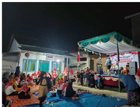
Wungon RT 03/04

Berdasarkan penuturan dari informan WD1 yang merupakan warga desa RT 07/04, malam Wungon dilaksanakan di halaman depan rumah warga yang luas.