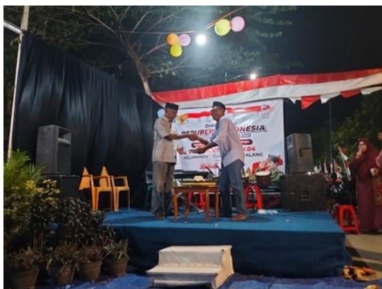
Wungon RT 07/04

Berdasarkan penuturan dari informan WD1 yang merupakan warga desa RT 07/04, malam Wungon dilaksanakan di halaman depan rumah warga yang luas.